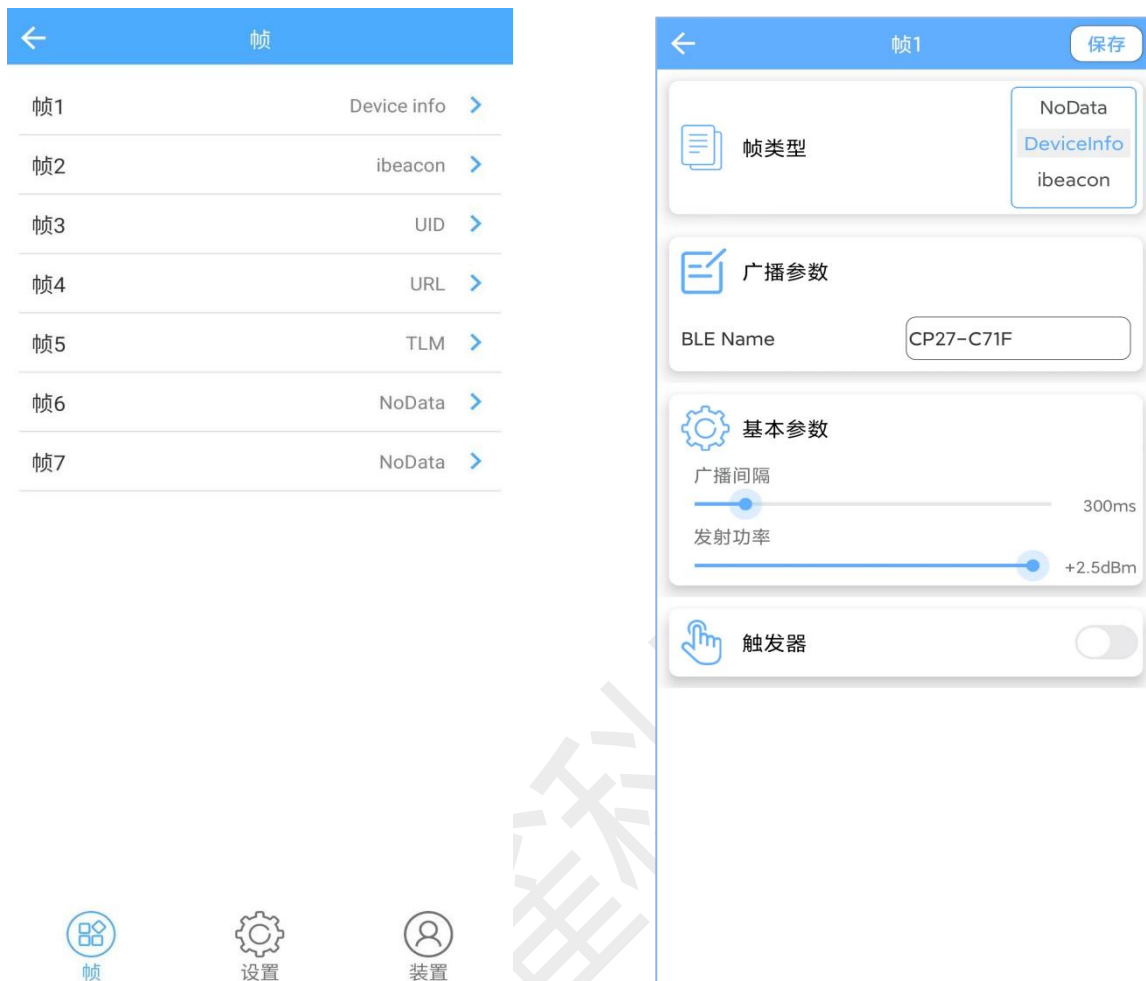
图 2：安卓 APP 界面图